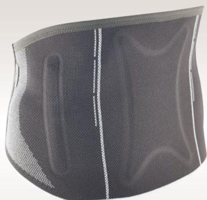
Cellacare Dorsal F