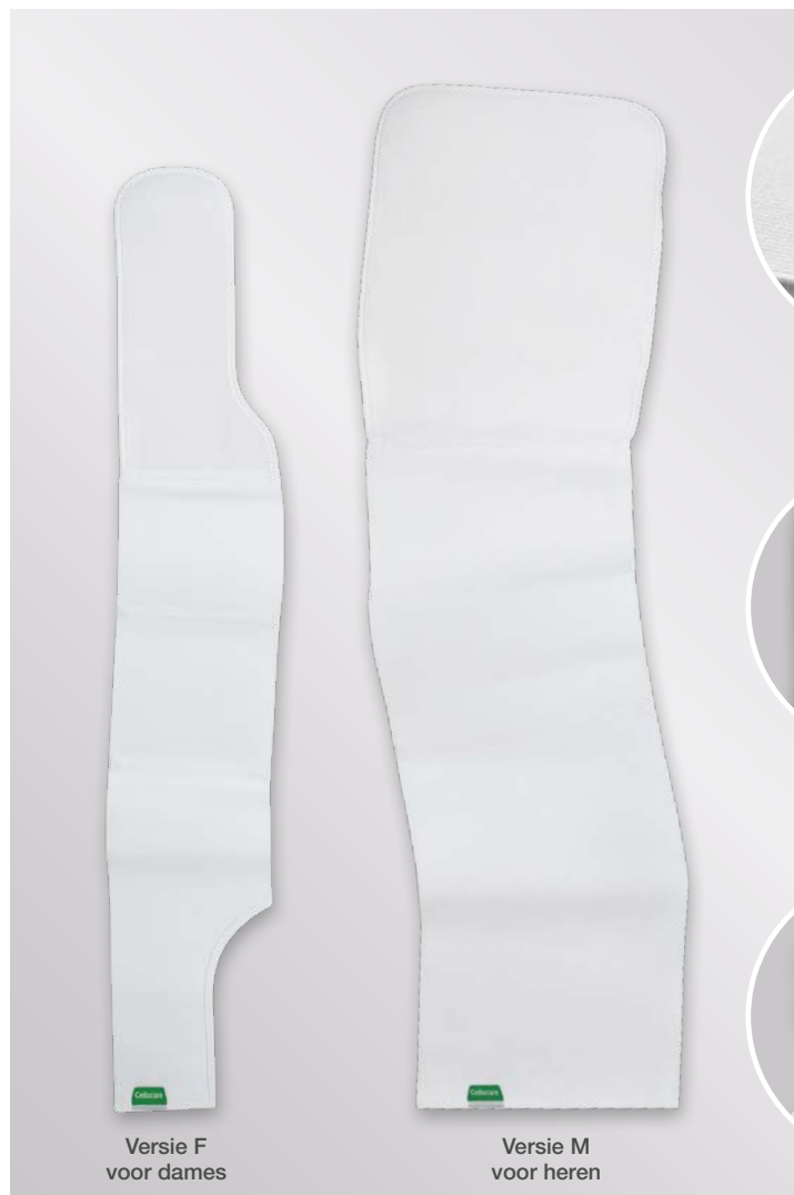
Versie F voor dames