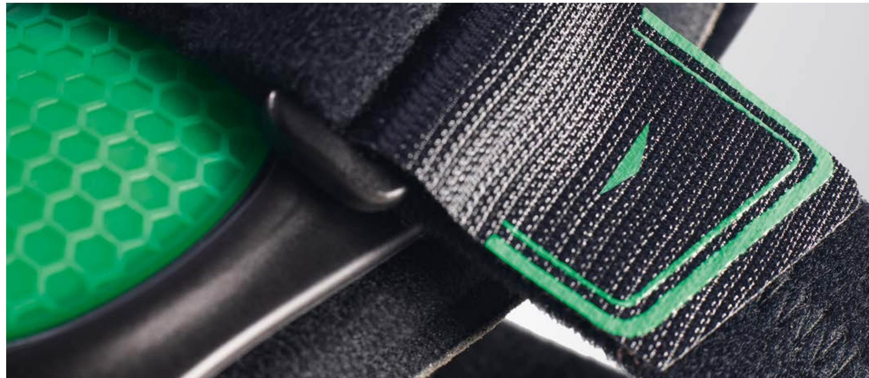
Verstelbare klittenbandsluiting voor individuele aanpassing

Zuivere functie in een pure vorm beschermt en ondersteunt de genezing, maar ook het dagelijks leven van uw patiënten.