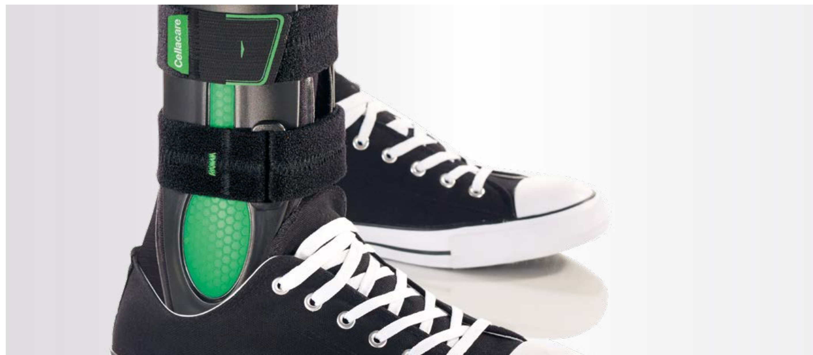
Te dragen bij de meeste soorten schoenen