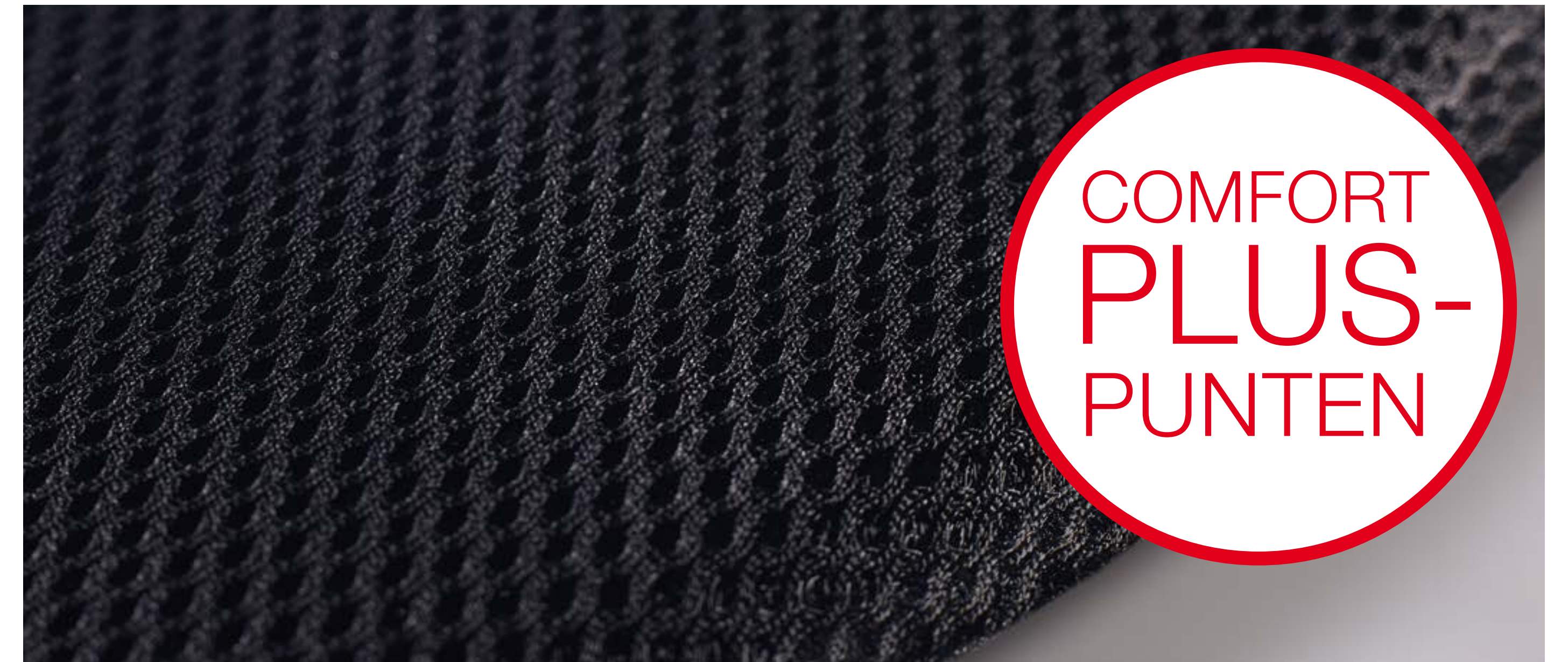
Zachte polstering aan de binnenkant, met mesh overtrokken