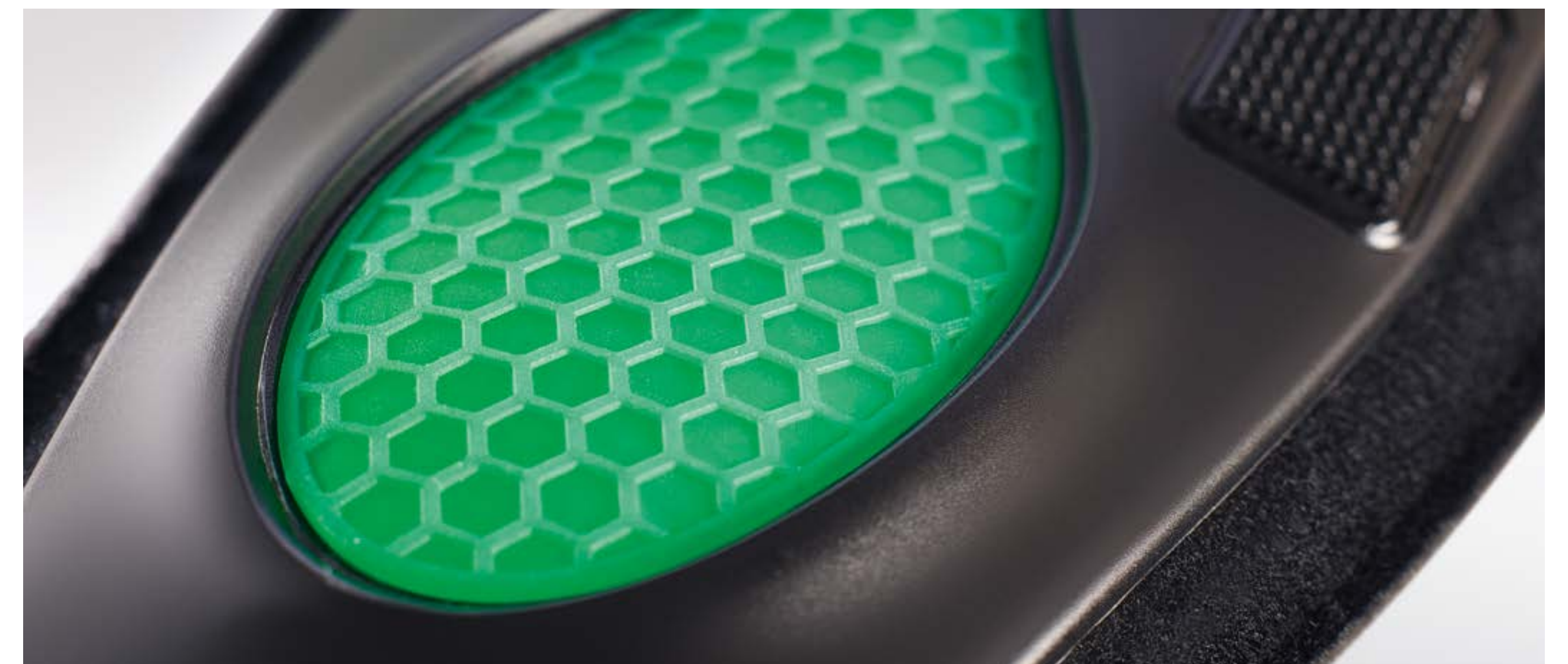
Flexibele ruimte voor de malleolus