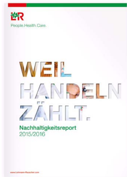
Bildunterschrift: „Weil Handeln zählt“ – der erste Nachhaltigkeitsreport der L&R Gruppe.