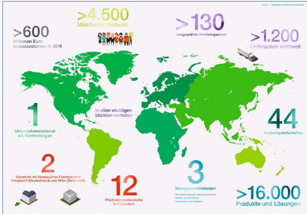
Bildunterschrift: Das weltweite Engagement der L&R Unternehmensgruppe in Sachen Nachhaltigkeit ist im Nachhaltigkeitsreport übersichtlich und ansprechend dokumentiert.